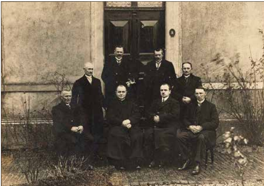
Bestuur Boerenleenbank.

Tijdens jaarvergaderingen in café Maes of in het R.K. Clubhuis, al dan niet na afloop van de zondagse hoogmis, spoorden zittende bestuursleden de leden