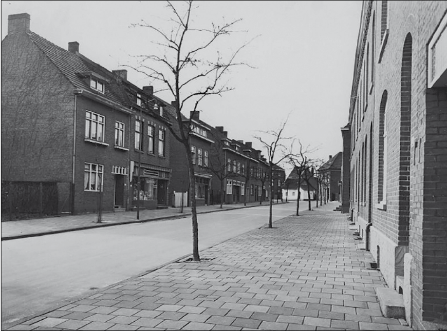
Winkelpanden in de Welvertuynstraat.

werden koud gehouden met dikke, doorzichtige staven waterijs (van circa 100 x 20 x 20 centimeter) die in de zomermaanden wekelijks werden geleverd door de NV Heerlense Ijsfabriek Nova Zembla aan de Laanderstraat. Zo bleven die goed geïsoleerde cellen net rondom het vriespunt. Soms was ik in de slagerij aanwezig bij het naar binnen tillen van die zware staven ijs op een leren lap boven op de schouder van de ijs leverancier. Later in de jaren zestig werd het koelen en vriezen overal elektrisch. In de smalle, betegelde etalage, stonden louter pondspakjes Ossenwit (rundervet) in pyramidevorm opgestapeld. Ten tijde van een slagerswedstrijd werd de etalage altijd gedecoreerd met een van Ossenwit geboetseerd beeld. Ik herinner mij ondermeer een door Kals vervaardigde bizon en zeemeermin.