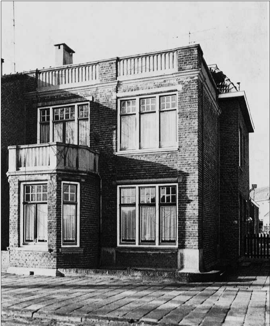
Het pand Pijnsweg 84 waar de Boerenleenbank Welten tot 1967 was gevestigd.