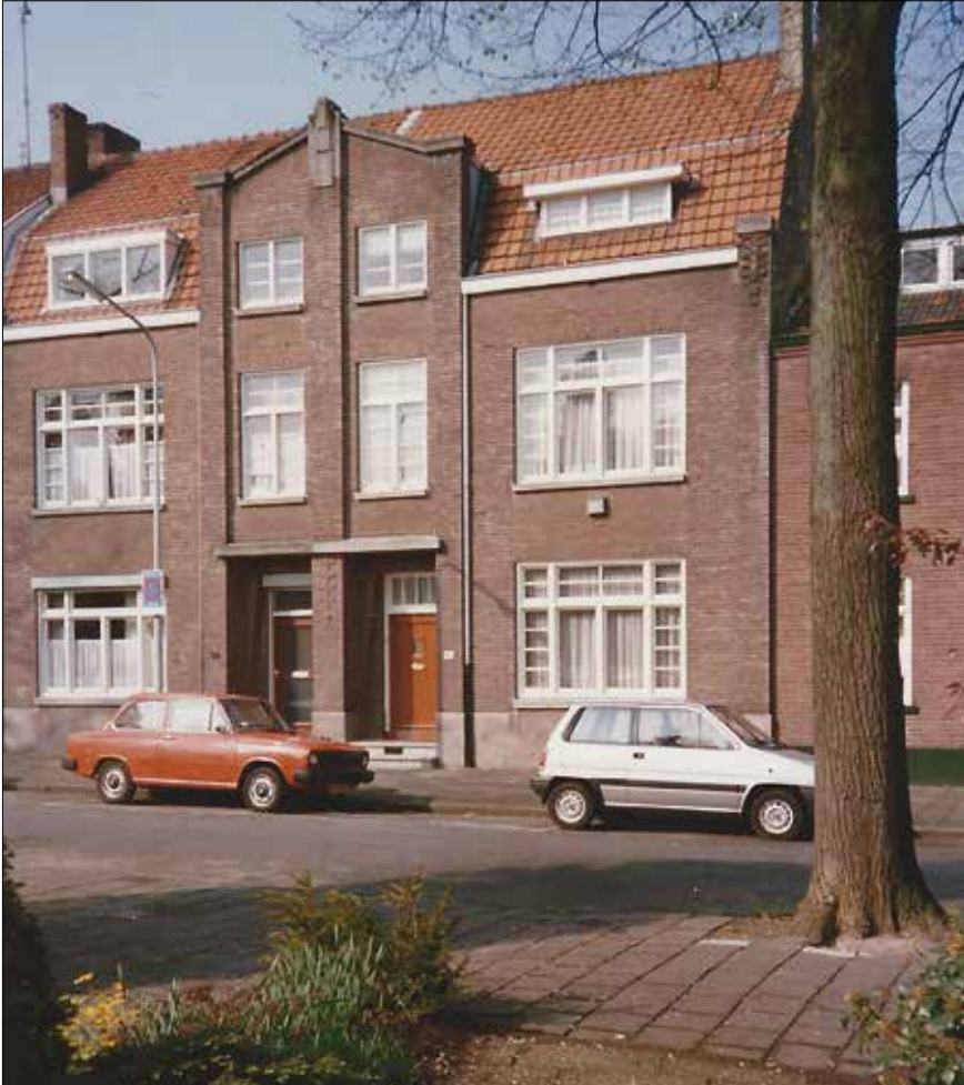
Links Pijnsweg 94.

zenders plus de R(egionale) O(mroep) Z(uid), die uitzond vanuit Maastricht. Het juiste afstemmen deed je, via de zacht verlichte zenderschaal met behulp van een draaiknop plus een felverlicht groen oog in de rechterhoek van de zenderschaal. Als je de peilwijzer langs de zenderschaal draaide, kneep het oog verticaal samen als de optimale afstemming bereikt was. In het onderste gedeelte van de boekenkast had mijn vader een elektrische, 78 toeren platen-speler ingebouwd. Deze werd echter nauwelijks gebruikt. Meer dan een handvol schellakplaten bezaten mijn ouders niet. Een bakelieten telefoon-toestel (met draaischijf) hadden we, zoals de meeste mensen in die tijd, niet.