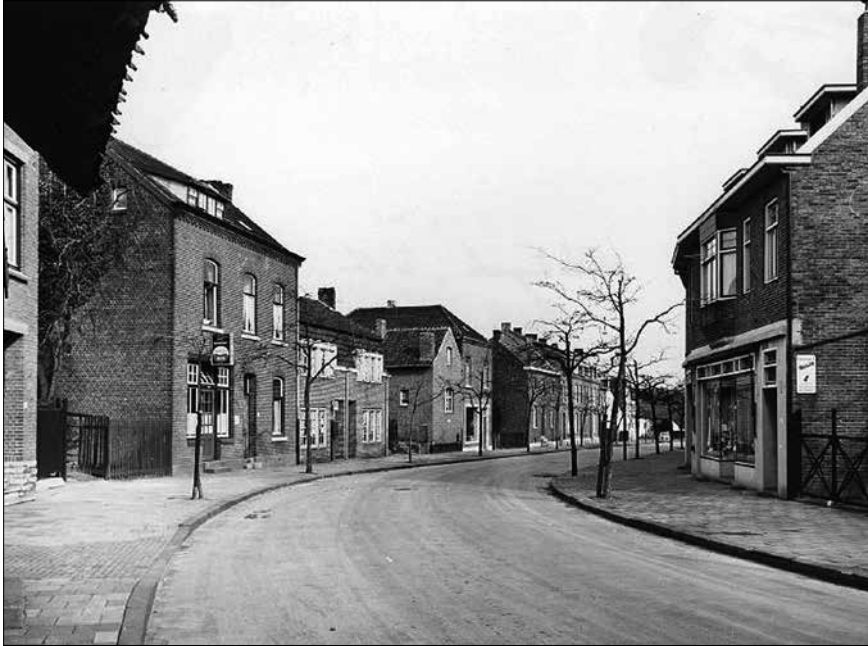
Welten-centrum rond 1960.

koteletten uit een groot stuk varkensvlees werden gehakt. Je zag en hoorde het hakmes door vlees klieven en botten versplinteren... Soms hingen er aan de haken tegen de betegelde achterwand meerdere, in de lengte gehalveerde varkens of koeien - zonder hoofd - ter verdere verwerking. Die huidloze kadavers waren voorzien van paarse controlestempels uit het slachthuis. Andere vleessoorten dan rund en varken werden er niet verkocht.