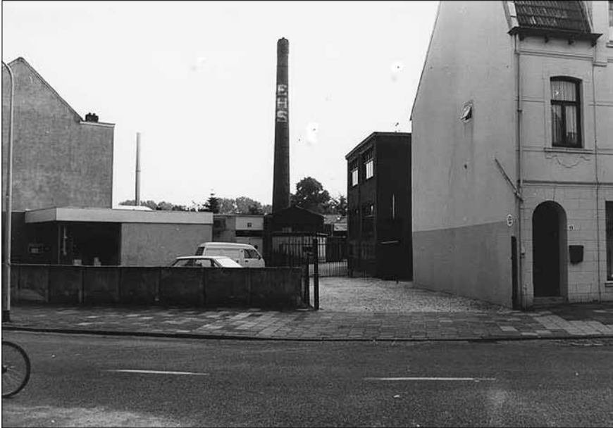
De EHS in 1986.

van de mijnen resulteerde in een enorme immigratiegolf van binnen- en buitenlandse arbeiders, al dan niet in gezelschap van vrouw en kinderen. Telde de Heerlense bevolking in 1895 nog 5.523 inwoners, in 1918 was de bevolking reeds gegroeid tot 27.666 inwoners. 6 Door de ontwikkeling van de mijnindustrie, de toename van de bevolking, de groei van de woningbouw, de verbetering van het wegennet en de uitbreiding van openbaar vervoer, nam het aantal fabrieken en bedrijven in en buiten Heerlen gestaag toe. De Eerste Heerlense Stoomwasserij was één van die bedrijven.