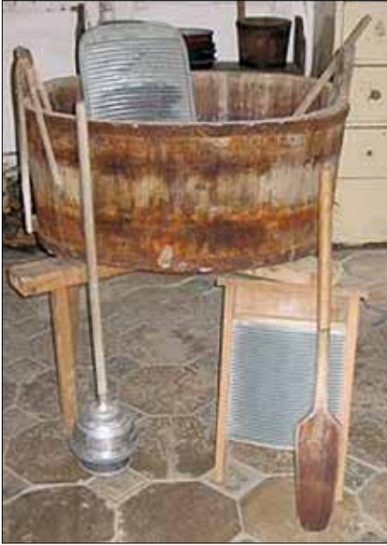
Wasbord en andere wasbenodigdheden.

toestel (1928), uitbreiding van wasserij en woning (1929), bouw van een aantal waterreservoirs (1932), gedeeltelijke vernieuwing van het woonhuis (1933), bouw van een naaikamer (1934), verbouwing van de stoomwasserij (1938), het bijbouwen van een kantoor (1942), de bouw van een ketelhuis met kolenopslagplaats en fabrieksschoorsteen (1947), het uitbreiden van de wasserij (1948), verbouwingen van het woonhuis (1972, 1976), enzovoort. 8