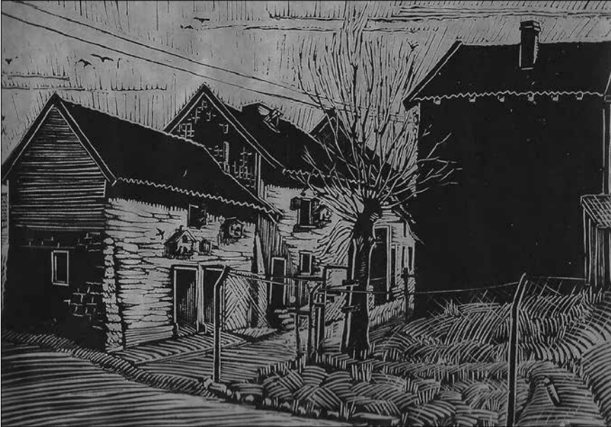
Linosnede van de Weltertuystraat 91-95.

ansichtkaart (idyllisch hoekje in Welten-Heerlen: - 'waar de huizen nog in behaaglyke wanorde liggen.' ) werd verkocht, ontsnapten niet aan de sloophamer. Ten gevolge van deze "onherstelbare verbeteringen" veranderde het historisch gegroeide stratenpatroon in dit agrarische gedeelte van de Tuynstraat op ingrijpende wijze.