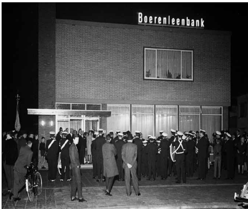
Opening nieuwbouw Boerenleenbank Welten, Pijnsweg 91, oktober 1966.

'Ondanks uw zeer grote bescheidenheid huldigen wij deze avond toch een andere opvatting. Gedurende 42 jaren hebt u met veel liefde, groot verantwoordelijkheidsbesef en een voortreffelijke sociale instelling enorm veel gedaan voor