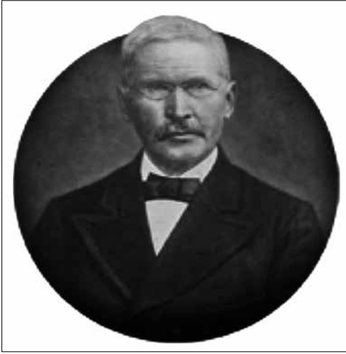
F.W. Raiffeisen, oprichter van de Boerenleenbank.