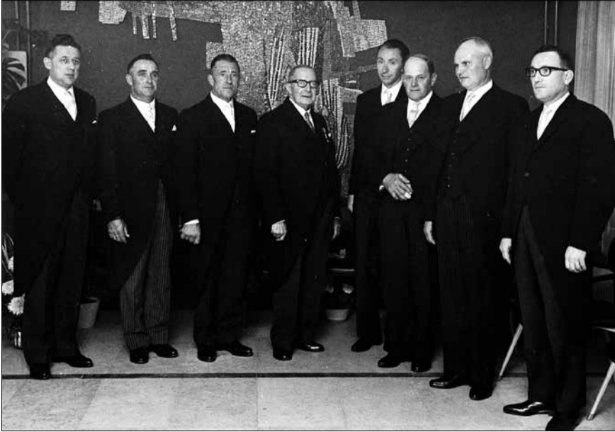
Bestuur Boerenleenbank.

In oktober 1966 werd het kantoor van Boerenleenbank Welten aan de Pijns- weg 91 in gebruik genomen. In 1968 volgden andere nieuwbouwkantoren, onder meer in de wijken Heerlerbaan, Hoensbroek, Heerlerheide en Heksen- berg. 14